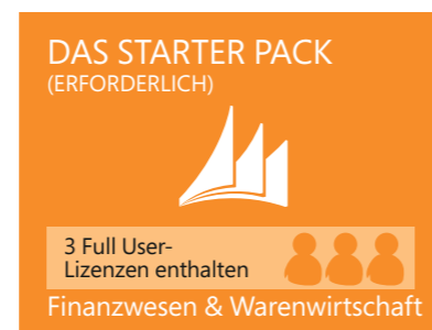
Abbildung 3: Starter Pack

Für viele Unternehmen sind die Funktionalitäten in dieser Lizenzkomponente bereits ausreichend.