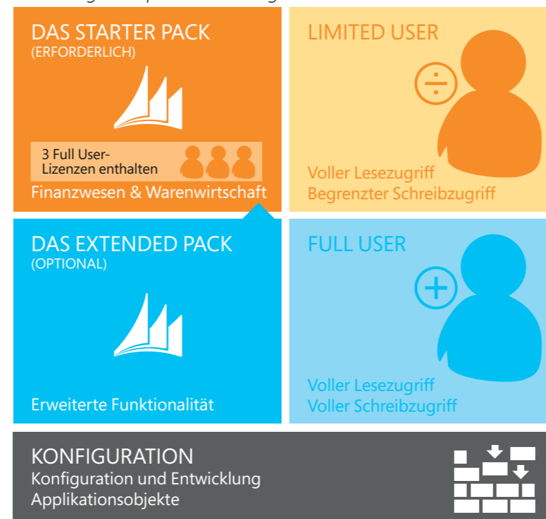
Abbildung 1: Perpetual Licensing im Überblick

Das Lizenzmodell Perpetual Licensing für Microsoft Dynamics NAV 2016 unterstützt mittelständische und kleine Unternehmen beim unmittelbaren, kostengünstigen Einstieg in die Bereiche Finanzwesen und Warenwirtschaft und ermöglicht ihnen, nach und nach weitere Bereiche einzubeziehen. Bei Perpetual Licensing lizenzieren Sie die Funktionalität der ERP-Lösung, und der Zugriff auf diese Funktionalität wird mittels Nutzerlizenzen sichergestellt.