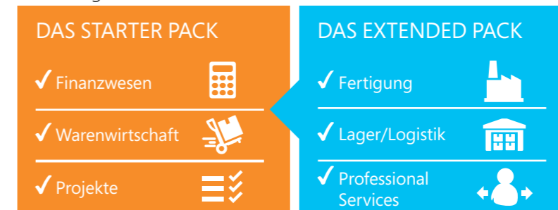
Abbildung 2: Starter Pack und Extended Pack – Funktionalität

Beide Lizenzmodelle wurden für größtmögliche Einfachheit im Kaufprozess konzipiert. Kunden können zwischen zwei Nutzertypen auf Basis von Concurrent Usern, das heißt nicht namensgebundenen Benutzern, wählen: Limited User und Full User. Zudem können sie bei umfassenderen Anforderungen den Zugriff dieser Nutzer auf das Extended Pack lizenzieren.